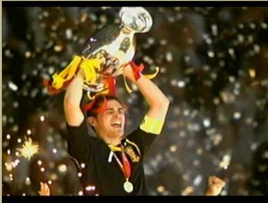
España Campeón del Mundo, ante todo fueron un equipo capaz de desarrollar una gran estrategia