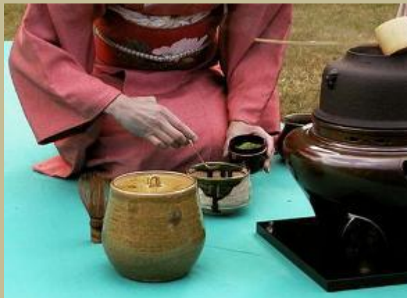
Ceremonia del Té

El maestro Takuan entendía a los factores externos (técnica) e internos (espirituales, actitud psíquica) como las dos ruedas de un carro, en consecuencia en el arte no se puede poner énfasis en el entrenamiento de uno solo de ellos. (Suzuki). En el excelente libro Secretos de los Samurai se destaca la importancia que todos los maestros adjudicaban a la independencia mental en el control del combate. Todos ellos ponían de relieve que la mente debía estar libre de cualquier atadura. En el deportista lo que hace perder independencia mental son las reacciones emocionales inadecuadas. Las ataduras de la mente dependen de las reacciones emocionales y atenazan el brazo del tenista o la mente del deportista en general. El problema no es el rival, ni la presión, el problema son las reacciones que desarrollamos frente a ellos. A continuación veremos un ejemplo de cómo una actitud apropiada salvó la vida y el honor de un maestro de Té que no sabía combatir. Designamos a esta actitud emocional con el nombre de ataraxia .